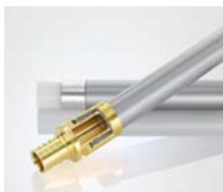
Соединение на подвижной гильзе