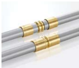
Возможность оптического контроля качества соединения