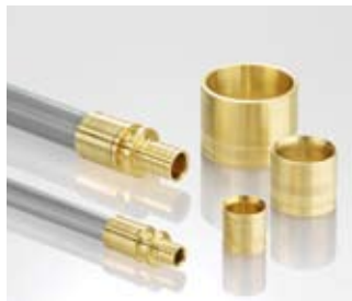
Единые трубы и фитинги для водоснабжения и отопления

Без чистой воды и тепла невозможно представить себе современный быт. Эти, казалось бы, само собой разумеющиеся блага были бы невозможны без современных трубопроводных систем.