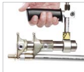
Запрессовать гильзу и соединение